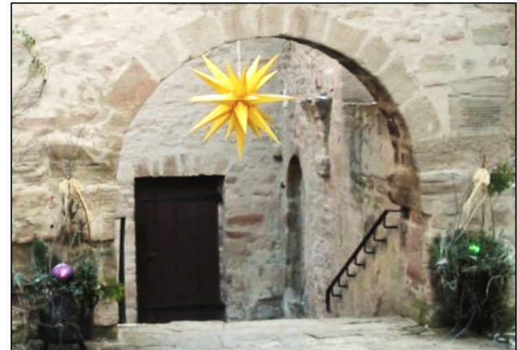
TÜREN IM ADVENT

AUFATMEN – AUFTANKEN EINKEHR, RUHE UND GEMEINSCHAFT